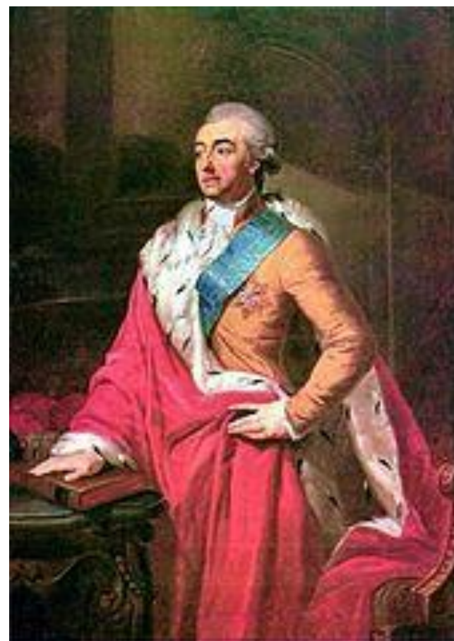
Adam Kazimierz Czartoryski