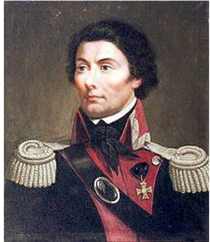
Kościuszko jako generał lejtnant wojsk koronnych w czasie wojny polsko-rosyjskiej 1792