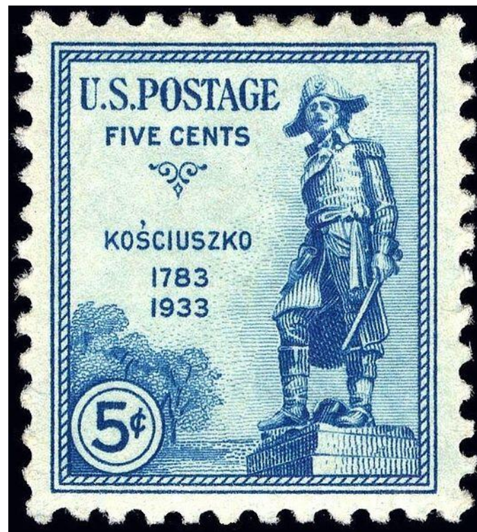
Amerykański znaczek pocztowy z Kościuszką wartości 5 centów