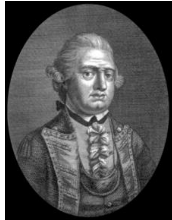
Generał Horatio Gates